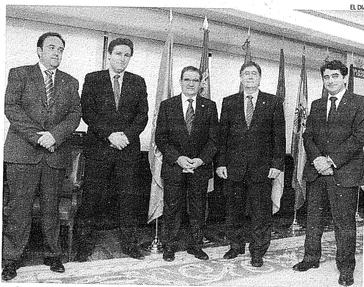
En la imagen, foto de familia tras la firma del convenio de colaboración.